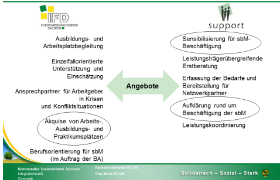
Die Angebote von support und IFD im Vergleich

Dabei ist zu beachten, dass der IFD Akquise- und Vermittlungsaufgaben nur wahrnimmt, wenn er dazu von einem Leistungsträger beauftragt wurde.